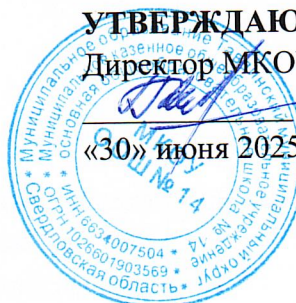
ГРАФИК ПРОВЕДЕНИЯ ИНСТРУКТАЖЕЙ ПО ОХРАНЕ ТРУДА